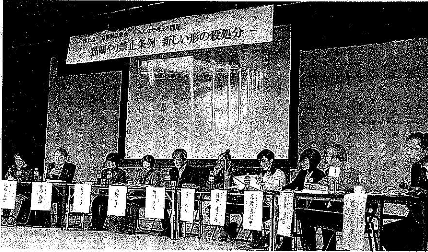
野良猫に避妊去勢手術をして管理し、住民トラブルを防ぐ「地域猫」の成果が報告された。下京区

野良猫に餌を与えることは是非か——。野良猫の保護に取り組む市民や弁護士が7日、京都市が制定をめざす「動物による迷惑の防止に関する条例（仮称）」について話し合う集会を下京区で開いた。無責任な餌やりを禁じた条例案について、「問題の解決にならない」と指摘する内容で、約180人が参加した。