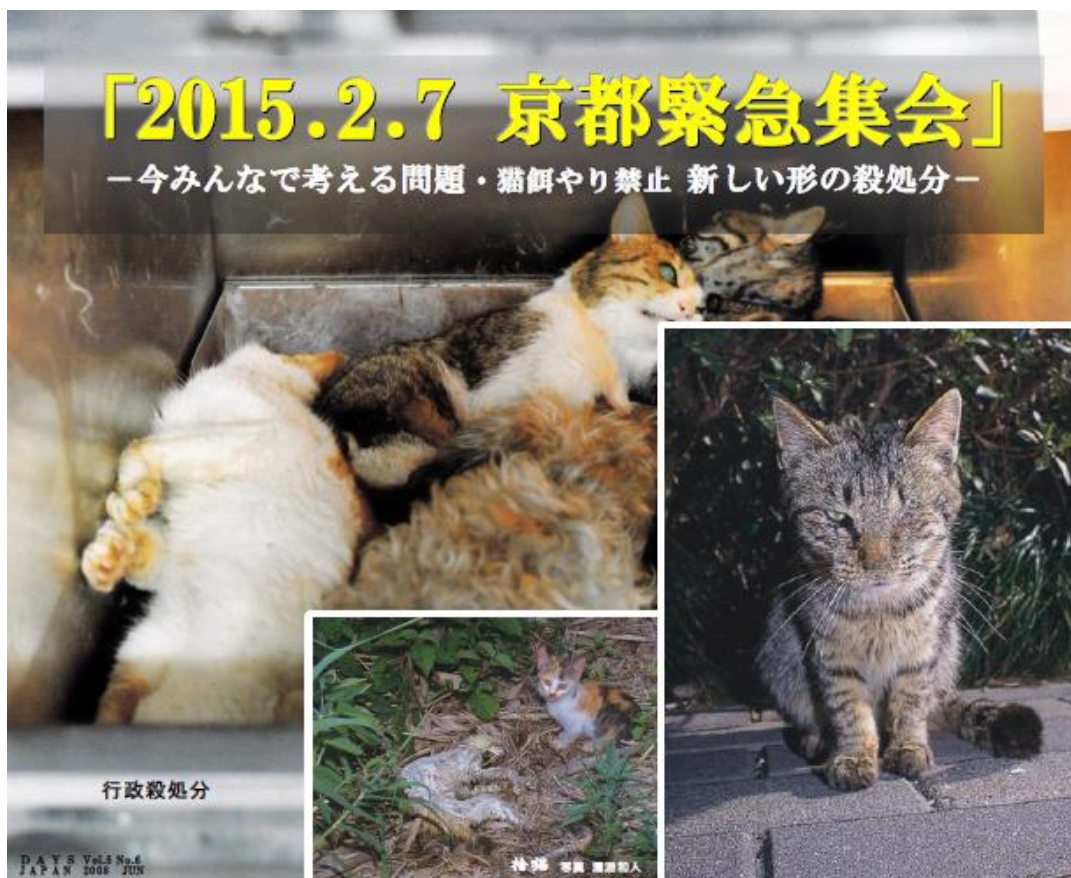
「改正動物愛護法では殺処分目的の引取り禁止と官民一体の野良猫保護責任」